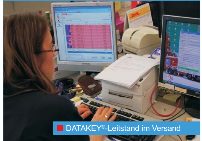
■ DATAKEY®-Leitstand im Versand

Im Zentrallager werden sämtliche Weine, Schaumweine und Feinkostartikel angeliefert und von hier auf die 18 Filialen verteilt. Kommissioniert wird in der Regel nicht nach Stück sondern nach Verpackungseinheiten. Bei Arbeitsbeginn holt sich der Lagerarbeiter über WLAN von der zentralen DATAKEY®-Datenbank seine Aufträge in das mobile Handterminal. Der Kommissionierung selbst erfolgt dann offline, erst für die Datenrückmeldung und bei Druck des Lieferetiketts ist wieder eine Funkverbindung erforderlich. Nach Auswahl eines Auftrags am MDE-Terminal erhält der