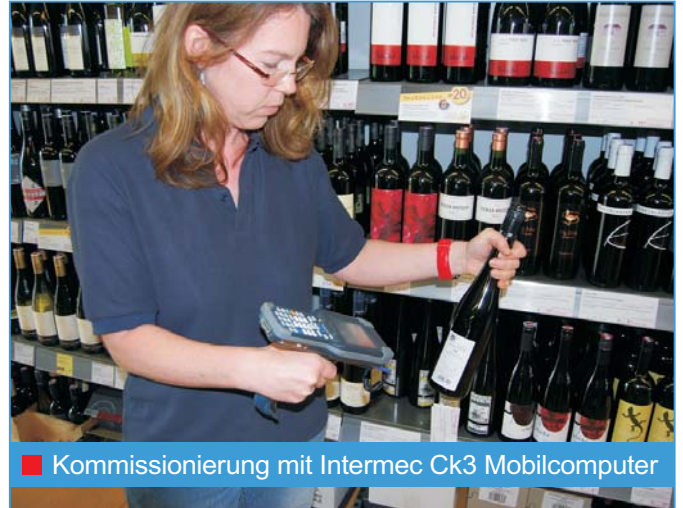
■ Kommissionierung mit Intermec Ck3 Mobilcomputer