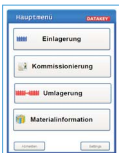
■ Hauptmenü am CK3