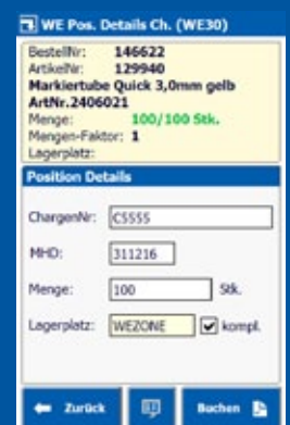
DATAKEY® mobile Applikation: Hauptmenü & Wareneingang